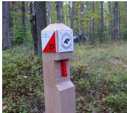
Projekt Jerzego Sudola – Nadleśnictwo Bytów