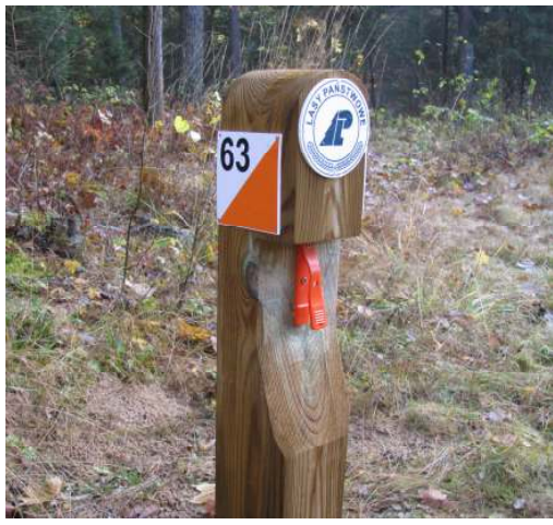
Projekt Piotra Sierzputowskiego- Nadleśnictwo Krynki